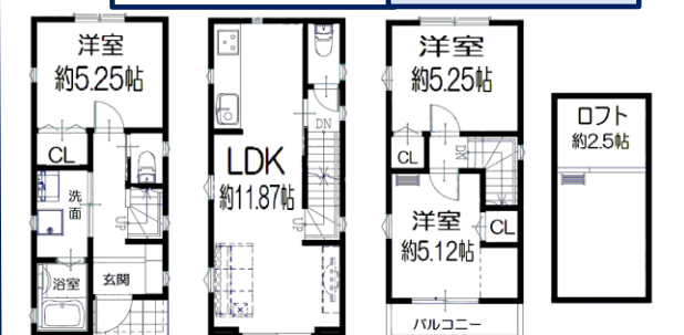
※上記間取りは、建坪20坪プランです。

2,780万円借入 35年払 頭金0円 0.875%の場合 月々約 7.7 万円