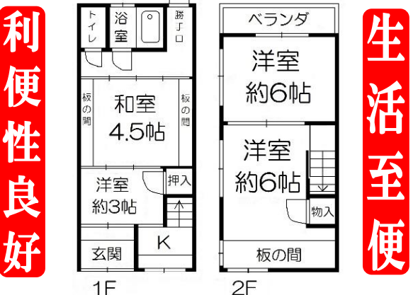
スーパー「コーヨー」徒歩2分

【物件概要】●所在地/大阪市福島区鷺洲4丁目 ●交通/JR大阪環状線「福島」駅徒歩6分●土地面積/72.90㎡(約22.05坪) ●延床面積/37.15㎡●構造/木造2階建●間取り/4K ●用途地域/第2種住居地域●準防火地域●築年月/築年数不詳 ●建ぺい率/80%●容積率/300%●現況/空家 ●引渡/相談●取引態様/仲介