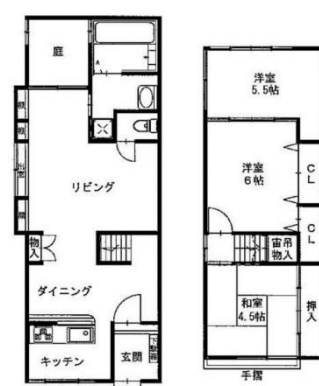
【物件概要】●所在地/大阪市福島区海老江7丁目 ●交通/地下鉄千日前線「野田阪神」駅徒歩5分・阪神本線「野田」駅徒歩5分 ●JR東西線「海老江」駅徒歩3分●土地面積/63.78㎡(約19.29坪) ●延床面積/81.48㎡●構造/木造2階建●間取り/3LDK ●用途地域/第2種住居地域●準防火地域●築年月/S2年 ●建ぺい率/80%●容積率/240%●現況/空家 ●引渡/即時●取引態様/仲介