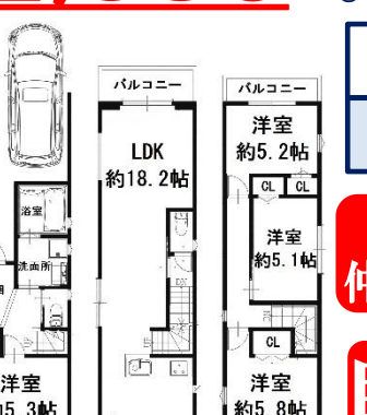
※上記間取りは、建坪31.9坪プランにつき2,795万円です。

【物件概要】●所在地/大阪市此花区伝法3丁目●交通/阪神なんば線「伝法」駅徒歩7分 ●土地面積/62.72㎡(約18.97坪)●延床面積/99.18㎡●構造/木造3階建 ●間取り/4LDK●用途地域/準工業地域●準防火地域●建ぺい率/60% ●容積率/200%●現況/上物有 ●引渡/着工後約3ヶ月●取引態様/売主