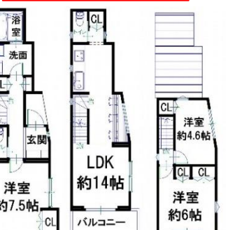
※上記間取りは、建坪25坪プランです。

【物件概要】●所在地/大阪市福島区大開1丁目 ●交通/地下鉄千日前線「野田阪神」駅徒歩3分・阪神本線「野田」駅徒歩4分 ●JR東西線「海老江」駅徒歩7分●土地面積/56.01㎡(約16.94坪)●セットバック有 ●参考延床面積/約85.51㎡●構造/木造3階建●間取り/3LDK ●用途地域/近隣商業地域●準防火地域●建ぺい率/80%●容積率/300% ●現況/上物有●引渡/着工後約3ヵ月 ●取引態様/仲介